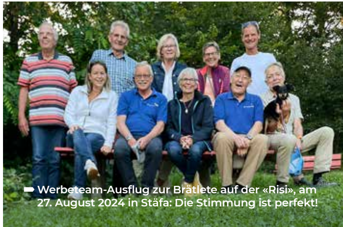
► Werbeteam-Ausflug zur Brätlete auf der «Risi», am 27. August 2024 in Stäfa: Die Stimmung ist perfekt!

Am 27. August haben wir nach der regulären Kommissionssitzung das ganze Werbeteam auf die «Risi» oberhalb von Stäfa eingeladen und einen wunderbaren Brätlete-Abendevent bei Top-Aussichtsbedingungen geniessen dürfen. Dabei stand das gesellige Zusammensein und die Pflege eines positiv wirkenden Teamgeistes im Mittelpunkt.